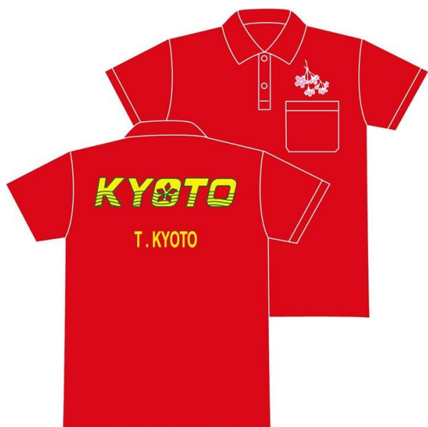
サブユニフォーム (赤)