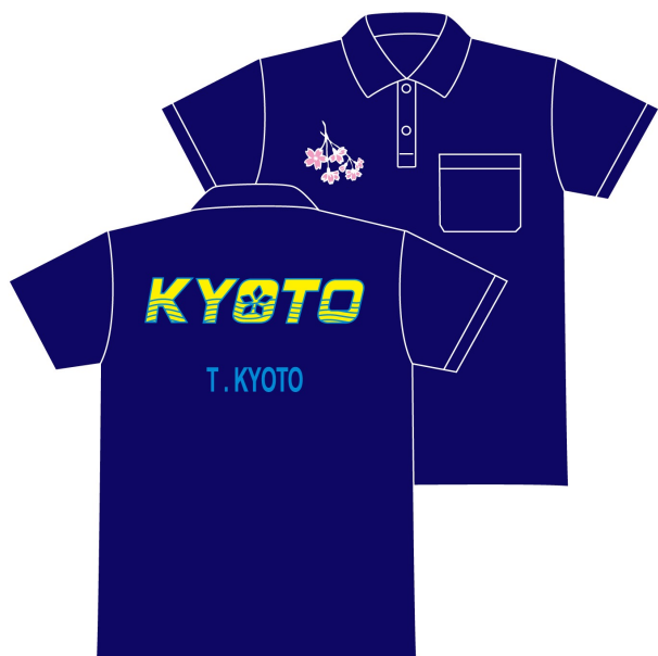
メインユニフォーム (紺)